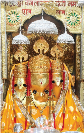
हरिभूमि न्यूज | नलखेड़ा

माघ मास की गुप्त नवरात्रि सोमवार से प्रारंभ हो गई। प्रथम दिवस माता रानी का आकर्षक पीताम्बर श्रृंगार किया गया था। माता रानी के गर्भगृह सहित सम्पूर्ण मंदिर परिसर को सजाया गया था। मंदिर पर आकर्षक विद्युत सज्जा की गई है। गुप्त नवरात्रि के प्रथम दिवस बड़ी संख्या में श्रद्धालु माता रानी के दर्शनार्थ सिद्धपीठ पहुंचे। प्रथम